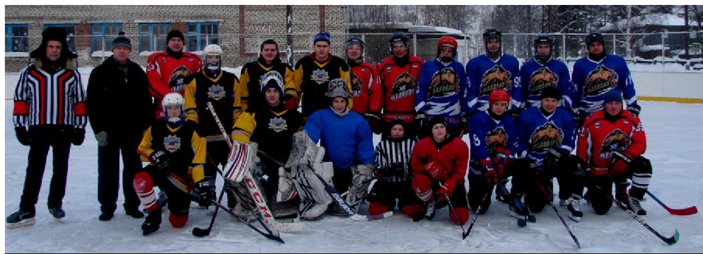
Участники Новогоднего турнира

4-5 января нового 2022 года на ледовом корте посёлка состоялся традиционный Новогодний турнир по хоккею. Необычным в этом состязании ледовых дружин было то, что в нём приняло участие ТРИ команды из нашего посёлка! Обычно в начале января каждого года хоккейные соревнования открывались поединками двух сборных – Сборной Мамы и Студенческой командой, состоящей из вернувшихся на каникулы студентов. Но, то ли студенты перевелись, то ли предпочли остаться в областном городе, в этом году выставить свою команду студентам было не суждено. Ситуацию спасли юноши из школьной команды, и молодое поколение хоккеистов, работающих в системе МЧС, «ТеплоРесурс» и те немногие студенты, что всё-таки вернулись домой.