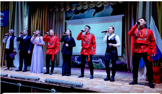
На сцене вокальная группа «Каданс»

– приобретение материалов для ремонта (600 тыс. руб.);