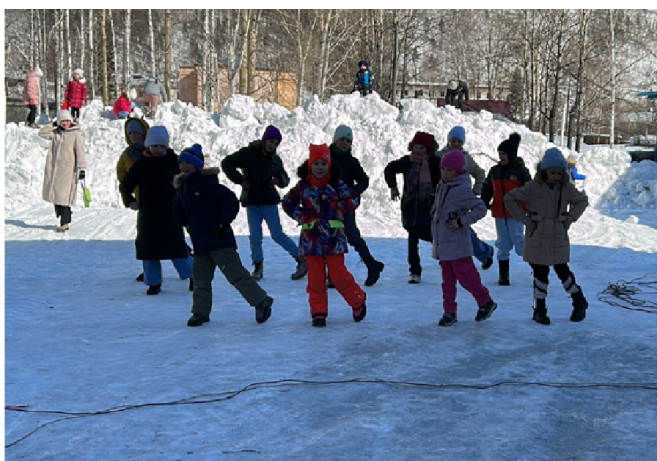
Завершился праздник сожжением чучела Зимы, но самое главное - все без исключения получили заряд хорошего настроения.