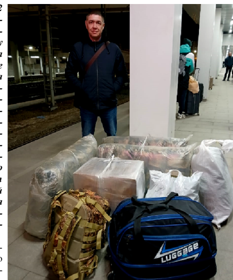
В ожидании "скорого". Вокзал "Восточный", г. Москва

24 февраля 2022 года жизнь многих разделилась на до и после. В борьбе за свободу и независимость, за счастливое будущее без нацизма Россия оказалась на передовой. Наши отцы, братья, мужья и знакомые стали участниками военной спецоперации по демилитаризации и денацификации Украины. Много тех, кто не бросает наших. Люди по всей стране объединяются для помощи и поддержки российской армии.