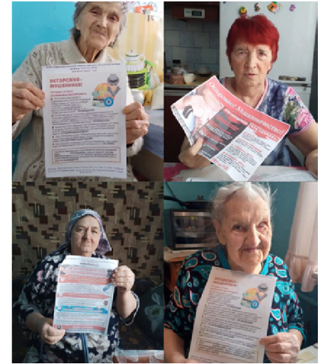
ОГБУ "УСЗСОН по Мамско-Чуйскому району"

По завершении бесед вручались памятки и буклеты гражданам пожилого возраста, которые будут напоминать о возможных действиях мошенников, а также указанных номерах телефонов горячей линии и экстренных служб.