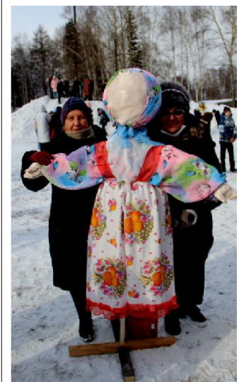
Фото на память, пока чучело Масленицы не сожгли