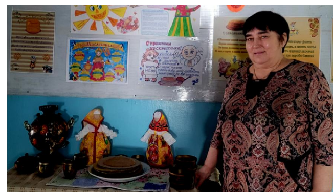
Учителями Мамской школы была организована выставка, посвященная Масленице, одному из самых популярных праздников в России, корни которого уходят в глубокую старину