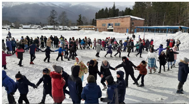
Массовый весёлый хоровод в честь Проводов Зимы