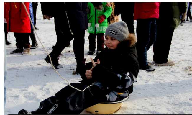
Дети с удовольствием участвовали в потешных играх: катании в тазах, перетягивании каната