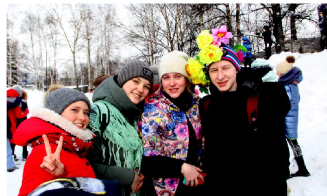
Праздник удался на славу. Гулянья прошли весело и шумно – Масленица не любит грусть и тишину