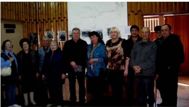
Открытие выставки "Телефон - 140" в фойе музея, приглашены связисты

Приложение 2 к распоряжению администрации Мамско-Чуйского района от 01.04.2022 года №71