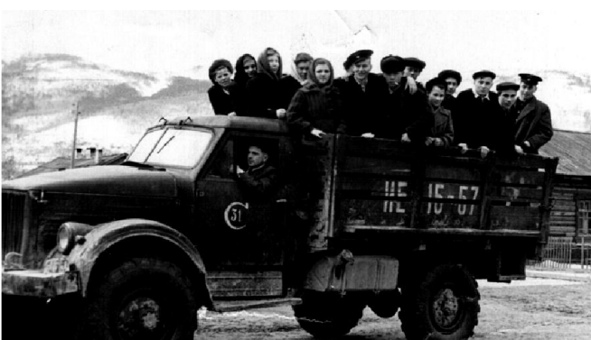
Комсомольцы мамского аэропорта, начало 60-х годов

В 1954 году поступил в Рижское авиационное училище, по специальности –