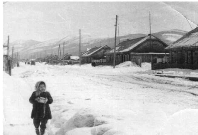
П. Мама, ул. Комсомольская, 1951 год.

Так сложилось, что по времени совпали 90-летние юбилей поселка Мама и Леонида Михайловича Вараксина, проживающего в поселке 77 лет.