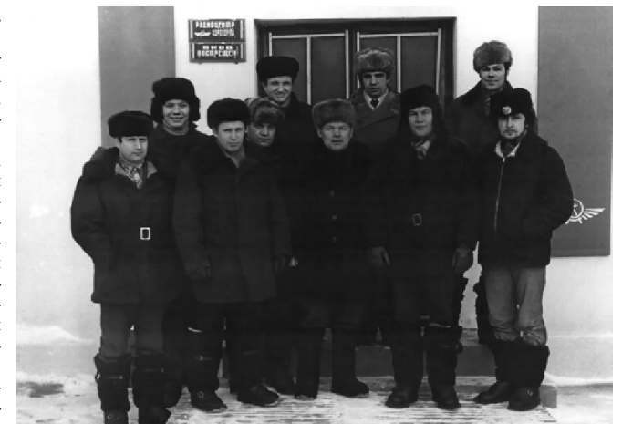
РАДИОЦЕНТР аэропорта МАМА. 7 ноября 1975 года, фото К.Г. Чиликина.

Пятнадцать лет назад, районная газета опубликовала большой исторический очерк - «Посвящается связистам». В нем