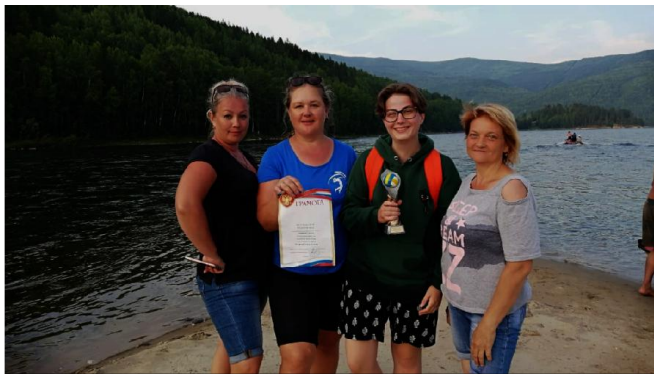
По итогам всех встреч кубок по пляжному волейболу 2021 взяла команда «Сибирячка», подтвердив свое звание сильной, опытной и выносливой команды.

встречали, для пляжных игр выбрано удачное место – не в черте посёлка, а на красивом острове. Здесь можно поиграть в любимую игру и искупаться в речке. Я получила столько положительных эмоций, отдохнула, зарядилась азартом игры и мечтаю вновь съездить на этот остров».