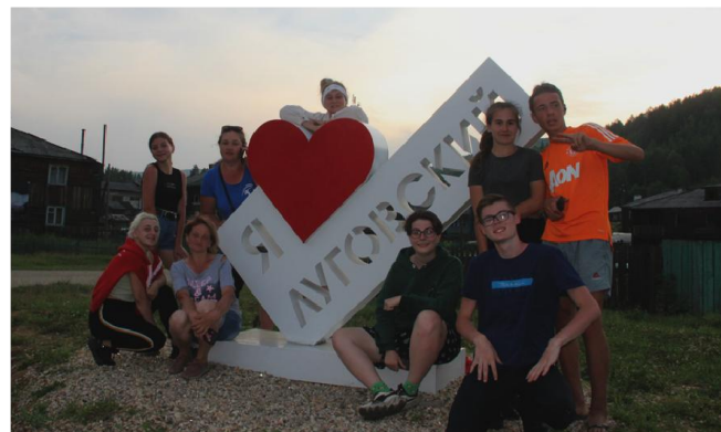
Гости п. Луговский из п. Мама сделали фото на память возле новой достопримечательности посёлка - стелы «Я люблю Луговский»

ке. Мне запомнится эта встреча большим разновозрастным составом команд. Возраст участниц пляжного волейбола, по словам организаторов, был от 14 до 49 лет. Солнце, пляж, речка, игры – всё было супер!».