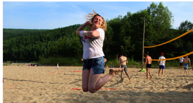
Кураж на Мамуровском острове

Технические условия подключения объекта к сетям инженерно-технического обеспечения: