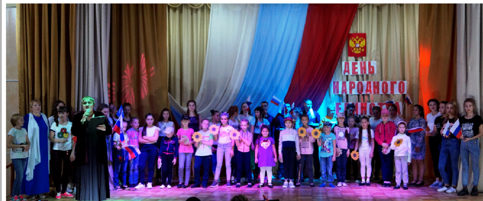
Большой и единый коллектив РКДЦ «Победа»

концерты, люди ждут его исполнения, а многие снимают его выступления и выкладывают видео в сети интернет.