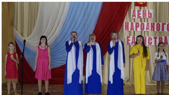
Народный коллектив «Мамчанка» исполнил песню «Мы единое целое» вместе с детьми вокального коллектива «Сибиряночка»