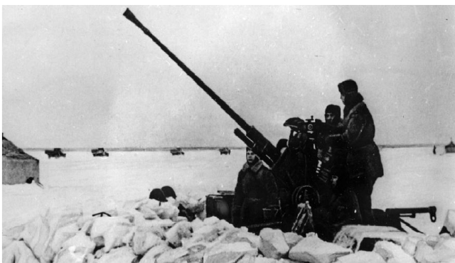
Дорога жизни «зенитное прикрытие»

Тяжелые, кровопролитные бои шли на юго-западных подступах к городу - у Лигово, Кискино, Верхнего Койрово, Пулковских высот, районов Московской Славянки, Шушар и Колпино. Это были