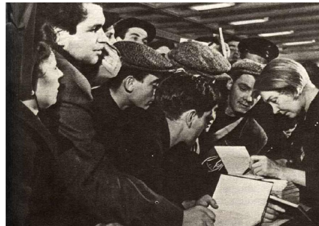
День поэта. Ольга Берггольц подписывает свои книги ленинградцам

Нет, земля, в неволю, в когти смерти Ты не будешь отдана, Пока бьется хоть единственное сердце Ленинградского большевика.