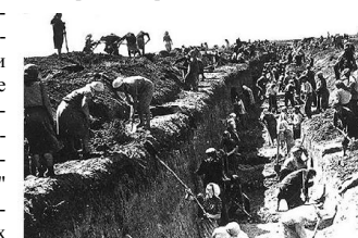
Ленинградцы на строительстве оборонительных сооружений

Десятки, сотни наших городов в годы Великой Отечественной войны стали местом ожесточенных сражений, местом массового героизма советских людей. Но особенно памятна нам славная оборона пяти городов - Ленинграда. Народ назвал его городом-героем.