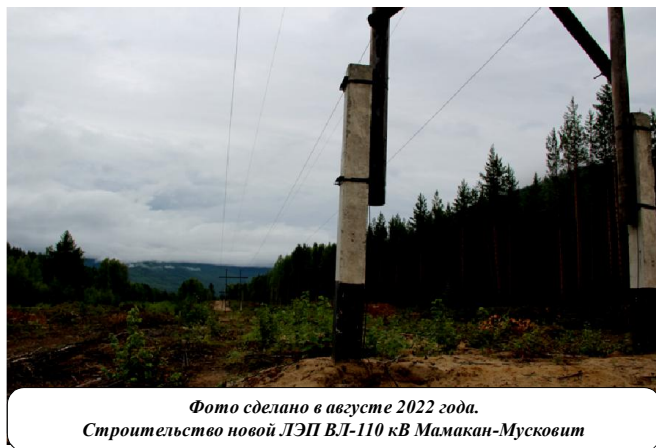
Фото сделано в августе 2022 года. Строительство новой ЛЭП ВЛ-110 кВ Мамакан-Мусковит

Начались трудовые будни строителей. Работы проходили в тяжёлых горных условиях. Устанавливать опоры приходилось на больших крутизнах, часто достигающих до 45 градусов. На такую крутизну поднимать строительный лес тракторами не было возможности. Приходилось прибегать к помощи ручных лебе-