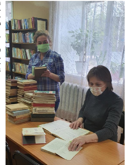
Статью подготовила: Библиотекарь ДКЦ С.С. Хоменко