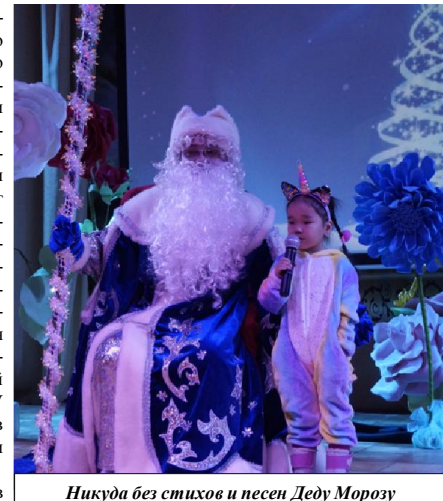
Никуда без стихов и песен Деду Морозу