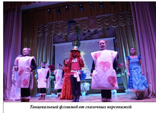
Танцевальный флэмиб от сказочных персонажей

очередной раз будут защищать свое звание, а вокальный коллектив «Мамчанка» будет праздновать юбилей – 40 лет с момента создания.