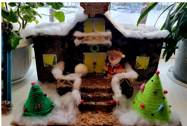
Дарина Капустина, конкурс "На струнах зимы"