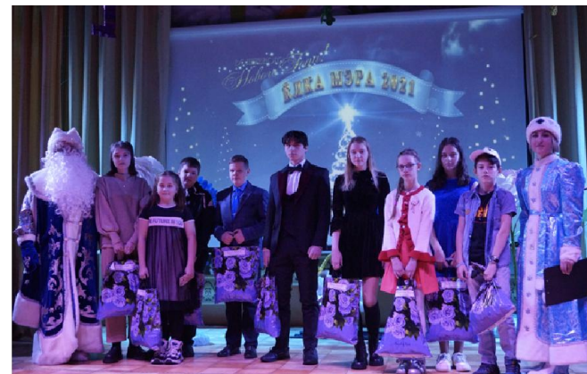
Дед Мороз и Снегурочка вручали подарки самым одаренным и талантливым детям района

Одним из самых заметных символов прихода новогодней поры в поселке Мама является здание районного дома культуры. РКДЦ «Победа» традиционно с начала декабря начинает свое преображение: загорелись разноцветные огни и прожекторы на площади; балкон украсила сказочная композиция, которая в этом году состояла из ростовых кукол Деда Мороза, снеговика, елок, разноцветных деревьев, а так же яркой упряжки из саней с подарками и чудесных оленей; в окнах здания появились снежинки, а вся внутренняя часть учреждения была украшена нарядной мишурой, гирляндами, световой аппаратурой. Второй этаж возглавляла большая красавица новогодняя ель.