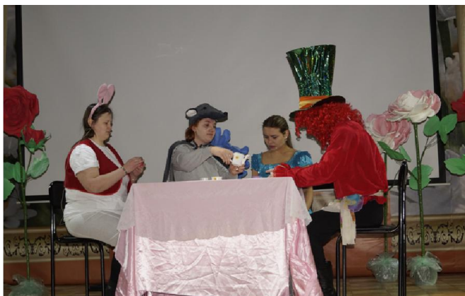
Алиса в гостях у Шляпника

Каждый ребенок, который вышел на сцену к Деду Морозу, уже артист, а дальнейшее развитие на пути к творчеству он может получить в РКДЦ «Победа», там, где к детям относятся с любовью и забо-