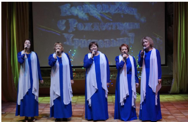
Народный вокальный коллектив "Мамчанка"

ности и в самом главном для детей ремесле – учебном процессе.