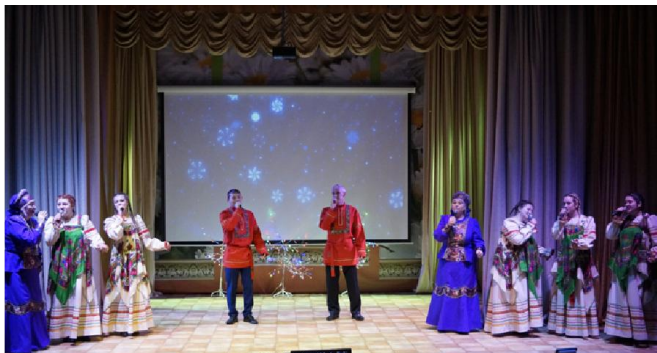
Народный фольклорный коллектив "Сударушки"

По хорошей традиции в преддверии замечательного праздника Нового года принято чествовать самых талантливых и одаренных детей Мамско-Чуйского района, которые добились больших успехов в спорте, музыке, художественной самодеятельности, волонтерской деятель-