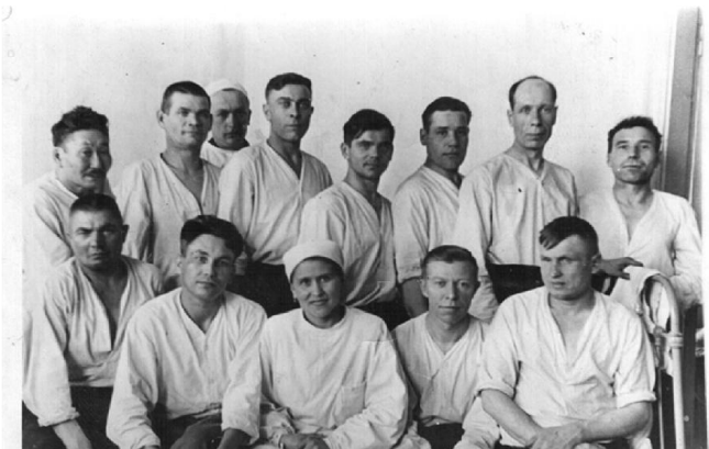
Госпиталь, 1952 год, Волков Ф.И.

Время неумолимо, человеческая жизнь коротка. Из большой, дружной,