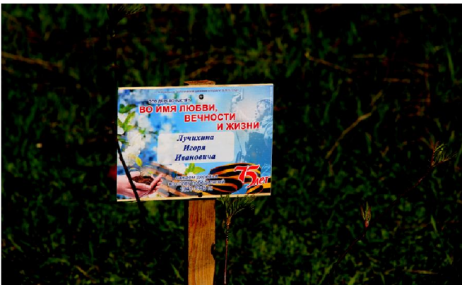
Во славу героев, проявивших отвагу и доблесть во время войны, оставших добрый след на мамской земле потомки высадили сад Памяти