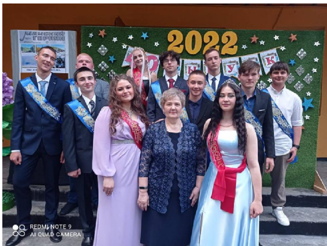
REDMI NOTE 9 AI QUAD CAMERA

Хочется пожелать нашим выпускникам сделать правильный выбор и уверенно идти к намеченной цели. В добрый путь, дорогие выпускники!