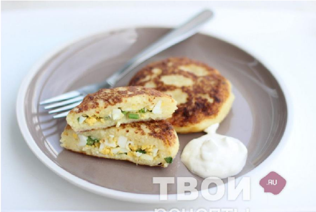
Рецепт взят с сайта твоирецепты.ру

Приготовление: Отварной картофель натереть на мелкой терке. Добавить муку, соль, перец и 1 яйцо. Перемешать до соединения. Разделить на 4 части. Отварное яйцо порубить, лук зеленый измельчить. На каждую лепешку кладем начинку, зажимаем края. Затем панируем зразы в муке и обжариваем с двух сторон до готовности на масле.