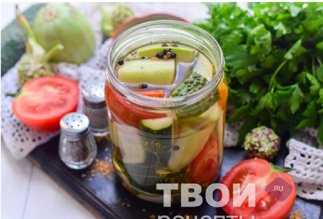
Рецепт взят с сайта твоирецепты.ру

Приготовление: Все овощи тщательно вымыть и просушить. Микс овощей должен быть свежим, желателно использовать все молодые овощи, идеально – собранные с грядки собственными руками, но так как не у каждого есть свой участок, купить можно овощи на рынке. Все почистить – морковь, перец, у огурцов обрезать хвостики с обеих сторон, у помидоров удалить место роста плодоножки. Мелкую морковь можно оставить в целом виде, огурцы разрезать вдоль, томаты разделить на 4 части, кабачки нарезать брусочками, перец нарезать произвольно. Банки для ассорти вымыть с