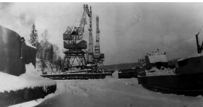
Отстой Кудимиха.