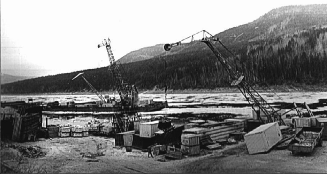
Конец навигации.