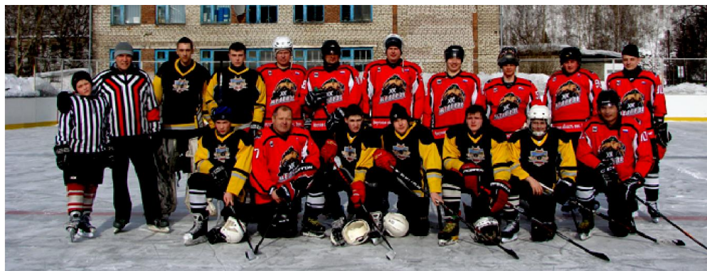
Традиционное фото перед игрой

Зима неуклонно стремится к своему завершению, как и семнадцатый хоккейный сезон. Традиционно он заканчивается Кубком мэра. В этом году финальные состязания выпали на субботу 19 марта. Несколько затянувшаяся зима подарила всем участникам соревнований великолепный солнечный день, без ветра, осадков и очень комфортной температурой для игры в хоккей.