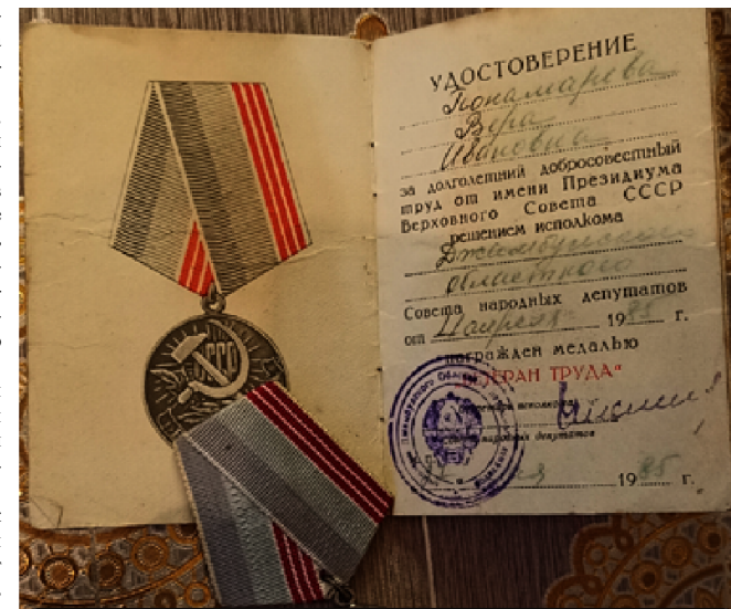
Удостоверение «Ветеран труда», полученное в 1985 году