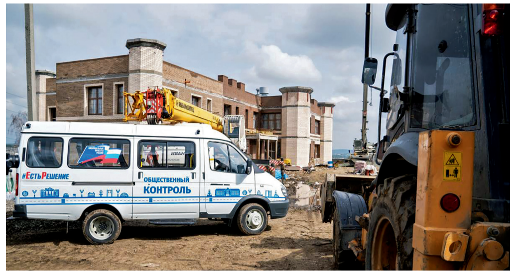
Строительство детского сада в поселке Маркова идет с опережением графика

Также она отметила, что в июне планируется распределить между муниципальными образованиями 300 млн рублей за эффективную работу по увеличению собственных доходов. Председатель бюджетного комитета предложила дополнительно обсудить вопрос о средствах на поддержку муниципальных образований первого уровня.