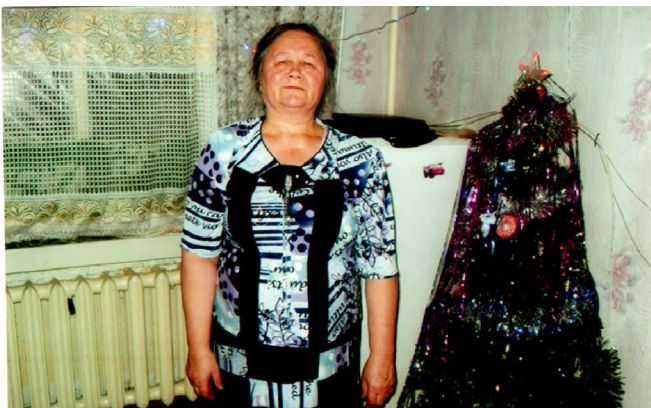
С любовью, дочь, внуки

Здоровья, сил и оптимизма Пусть Господь тебе дает, Чтоб долго наслаждалась жизнью И радостно смотреть вперед!