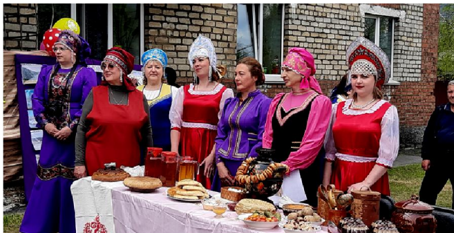
Завершал парад национальностей коллектив центральной библиотеки, который представлял русский народ

ших сверстников сталкиваются с бесплодием (как мужским, так и женским)