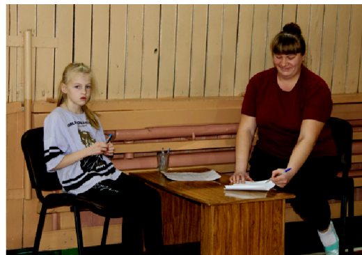
На этапе «Викторина на смекалку» можно было немного отдохнуть от физических нагрузок