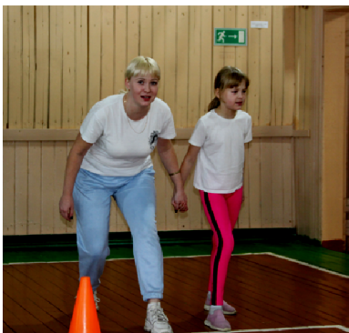
К челночному бегу готовы!