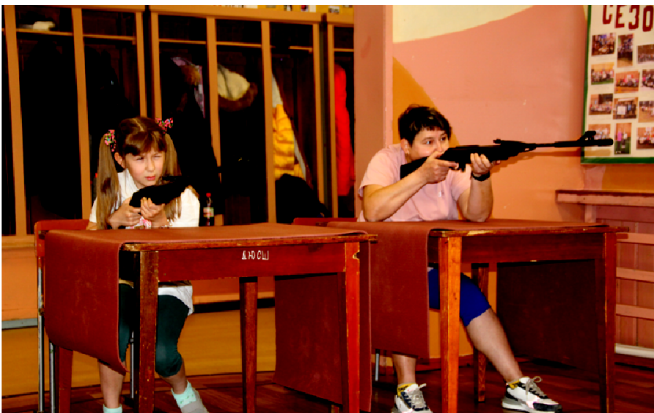
Когда мама отличный стрелок, тогда в семье спокойствие и порядок