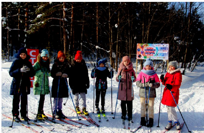
На фоне баннера «День зимних видов спорта» сфотографировались юные участницы лыжного забега