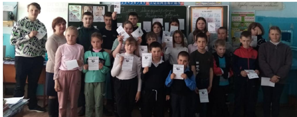
«Просить совета есть величайшее доверие, какое один человек может оказать другому».