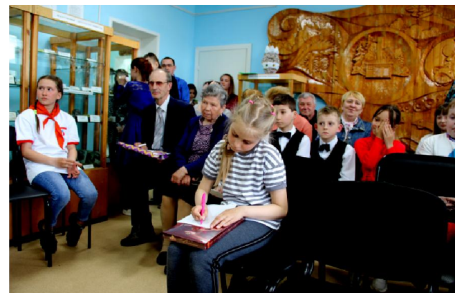
Юная гостя музея пишет послание своим потомкам для капсулы времени, которую откроют на 100-летие поселка Мама

заданием завершился традиционный праздник. – Международный день музеев – важный праздник и настоящий культурный феномен, ведь он напоминает нам, жителям, о необходимости любить и знать свою историю. Наш краеведческий музей - не просто систематизированное собрание редких предметов и документов, это, прежде всего, наша общая память. Времена меняются, многих людей, которым когда-то принадлежали эти