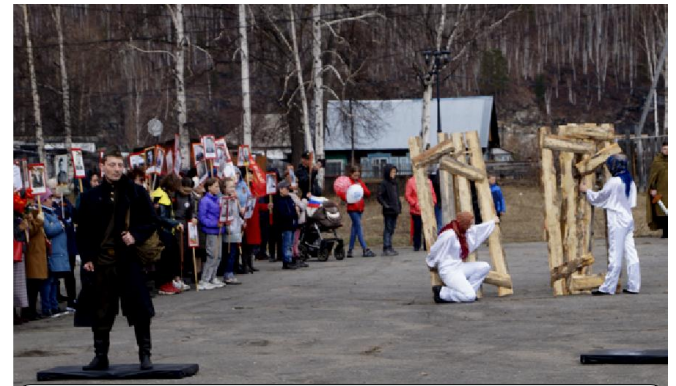
Ожившие скульптуры памятников Солдата Советской армии и Тростенец - врата памяти

Хореографические коллективы показали танцы военных лет. Эти танцы были полны грусти, боли и утраты, тем, что пришлось пережить русским людям во время войны, но больше всего в этих танцах было надежды и веры в светлое будущее. Вокальные коллективы в свою очередь исполнили песни военных лет. Многие песни были знакомы зрителю, и они с радостью подпевали.