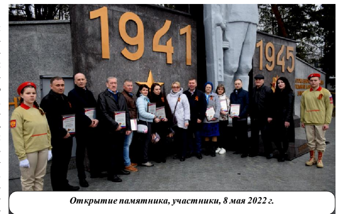
Открытие памятника, участники, 8 мая 2022 г.