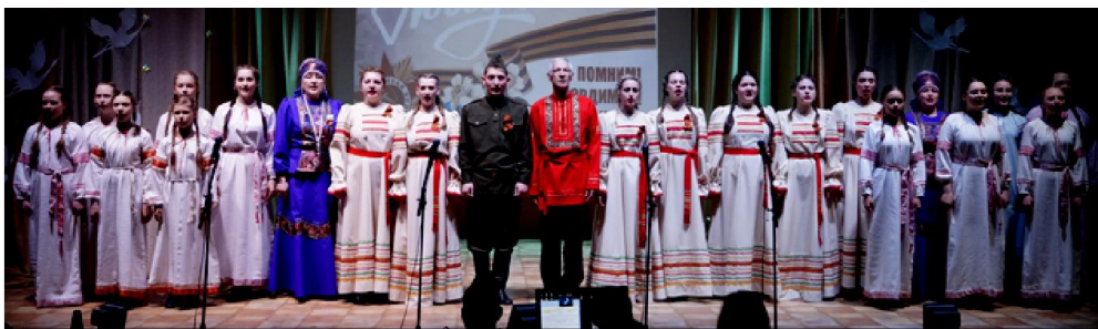
Песней от героев былых времен участники творческой самодеятельности РКДЦ "Победа" встретили уважаемых гостей

9 Мая весь мир отметил величайший праздник - 77-ю годовщину Победы советского народа в Великой Отечественной войне.