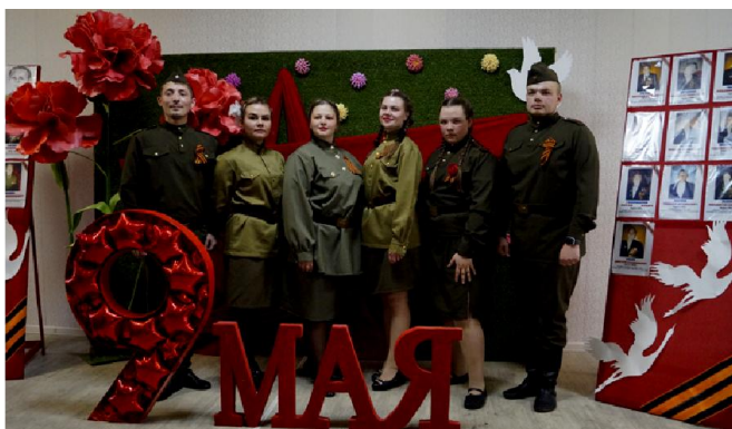
Вокальный коллектив "Каданс" на фоне тематической фотозоны

дом на переполненную площадь вступила колонна Бессмертного полка.