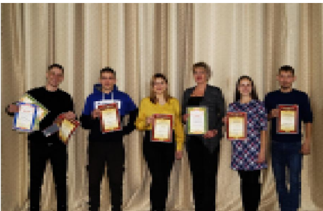
Самым главным событием и подведением итогов фестиваля «Сияние России» стал проведенный коллективом РКДЦ «Победа» конкурс «Песня - душа Народа», который прошел с 1 по 10 октября для всех жителей поселка Мама.

Люди золотого возраста являются уникальными хранителями истории и культуры нашей страны, ведь раньше в каждом городе и в каждой деревне пели свои песни, танцевали разные танцы, даже праздники формой проведения и