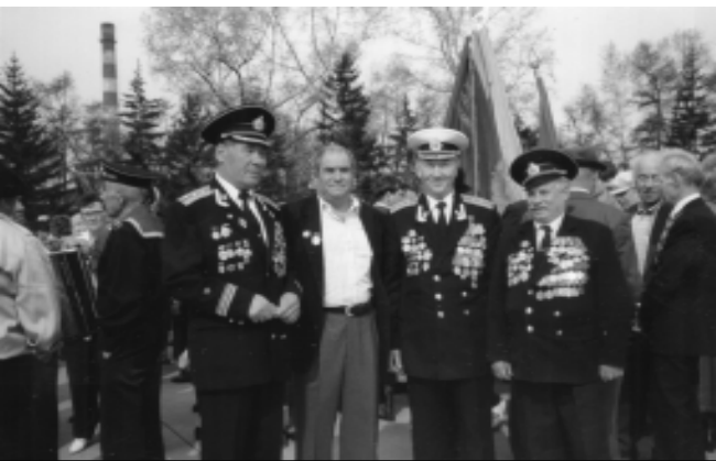
Владивосток. 60 лет Тихоокеанскому флоту.