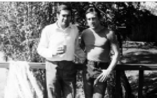
Ю.А. Елистратов, В.С. Высоцкий. 1976 г.