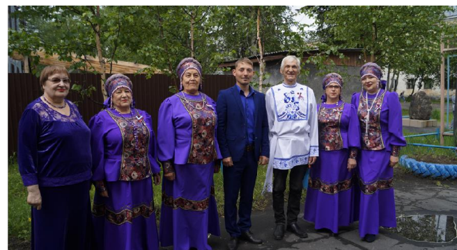
Исполнители государственного гимна России вокальный коллектив "Русская песня"

народному Дню защиты детей. Победители получили сладкие призы и детские игрушки.