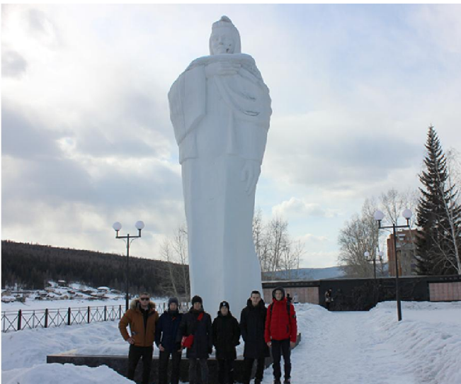
Возле мемориала памяти погибших жителей Усть-Кута «Родина-Мать»

Слаб не тот, кто не знал поражений, а тот, кто сдался без боя. А мамчане отчаянно боролись. Эта поездка сделала команду сильнее, футболисты прошли проверку на прочность и знают свои сильные и слабые стороны, чтобы упорно работать над ошибками. Не бывает побед без поражений! Значит, победы наших юных футболистов на «Кубке Севера» ещё впереди. Главное, чтобы были неравнодушные люди, готовые помочь реализовать эти амбициозные планы и развивать наш юношеский футбол.