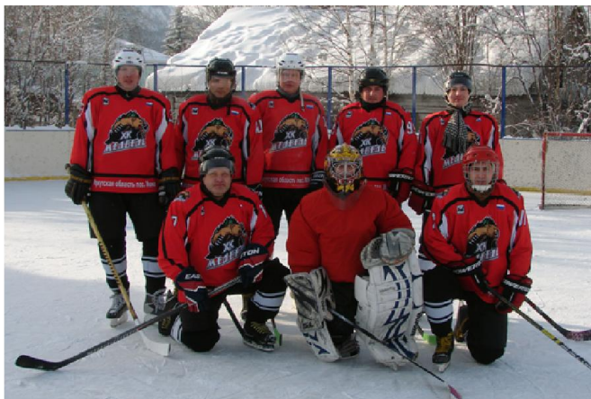
Хоккейная команда из Мамы - "Медведи"