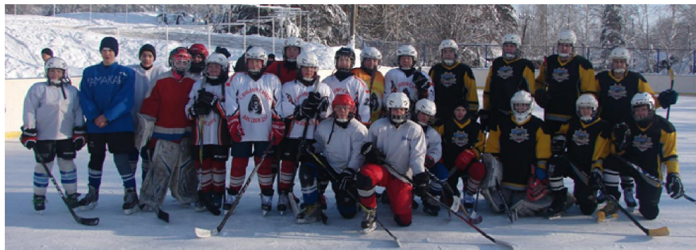
Перед первой игрой. Команда "Сибирские медведи" (девочки) и ХК МСОШ

7 февраля рано утром из районного центра выехал автобус, уносивший две команды хоккеистов на заснеженному зимнику на традиционные соревнования в соседний район, а точнее – в рабочий посёлок Мамакан.