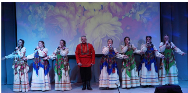
Народный фольклорный коллектив "Сударушки"

Поэтому коллектив РКДЦ «Победа» в целях организации правильного досуга среди населения Мамско-Чуйского района проводит такие мероприятия. Ежегодно проводятся театрализации: проводы зимы, майские праздники, День защиты детей, Новогодняя Елка мэра Мамско – Чуйского района и Поселковый детский утренник.