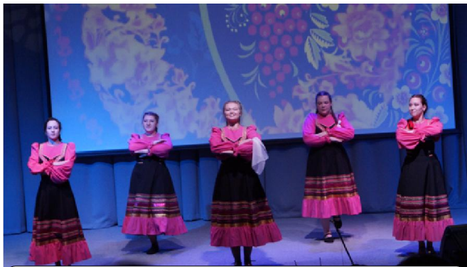
Хореографический коллектив "Тандем"