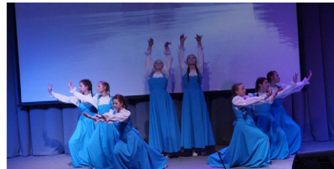
Хореографический коллектив "Палитра"

После выступления зал аплодировал стоя, многие фотографировались с коллективом, узнавали, как зовут артистов, рассказывали про впечатления от мероприятия, а некоторых, упустил их имена, звали работать или учиться в Бодайбо,