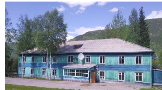
МКО «Мусковитская СОШ»

Говоря об учителях, о школе, да и людях, живущих в рудничных поселках, нельзя не упомянуть и об условиях их проживания. Ведь посмотрите, в каких домах тут все живут, они во многом изжили свой срок и являются аварийными. В начале 2000-х в поселке Мусковит, а в 2018 году в посёлке Колотовка были закрыты котельняки, и люди были вынуждены перейти на печное отопление и электрообогрев. Уже длительное время вода только приезжая, а ведь воду из бочек нужно еще перенести в дом. Население - в основном одинокие и пожилые люди, которым крайне сложно справиться с