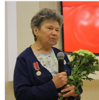
ЮБИЛЕЙ ГАЗЕТЫ «МАМСКИЙ ГОРНЯК»

«В бой за свободу!» - словно клич боевой Повис над горами, повис над тайгой И приехали люди в тридцатых годах В таёжной глубинке слоду добывать. Из мамского края до самой Москвы Журналистские строчки известье несли Об ударном труде, о добыче слоды, Которая шла на защиту страны. Вместе с народом, в едином строю «Мамский горняк» отстоял всю войну.