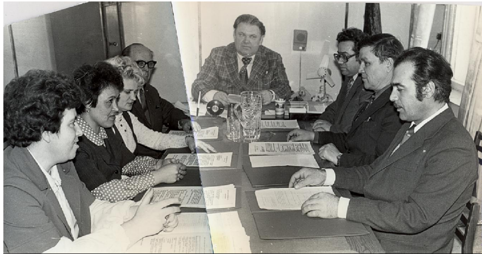
Заседание исполкома Мамского поселкового Совета депутатов трудящихся. 1979 год.