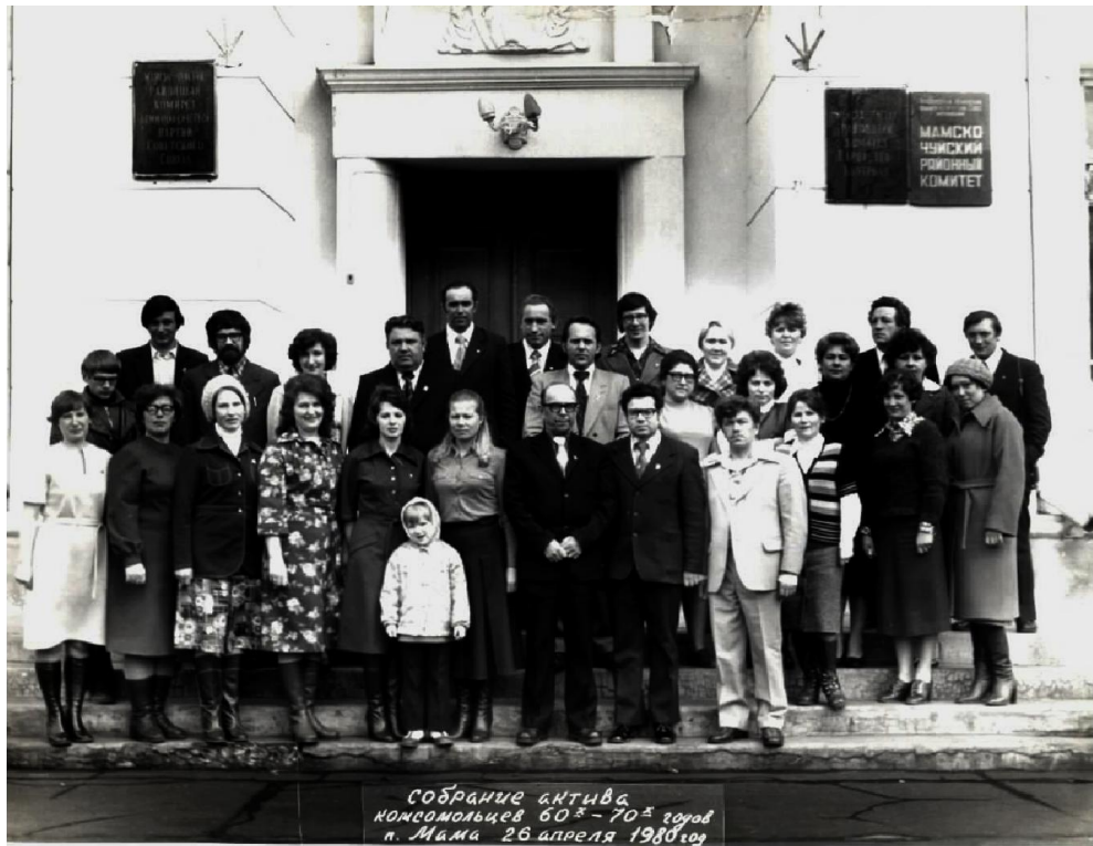
Собрание актива комсомольцев 60 х -70 х годов в Маме 26 апреля 1980 год