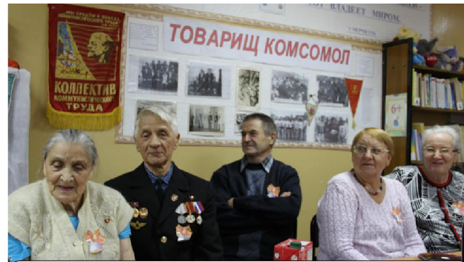
«Главное, ребята, сердцем не стареть». Пусть название песни станет девизом для людей «серебряного» возраста»