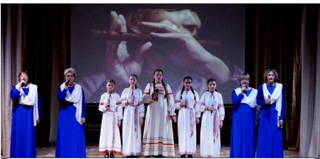
«Выступления творческих коллективов «Сударушки» и «Мамчанки» становятся «гвоздём» любого праздничного концерта»

- «Для хорошего поступка не нужен повод, только желание». А когда война на Донбассе стала угрожать России, стал первым добровольцем из Мамско-Чуйского района.